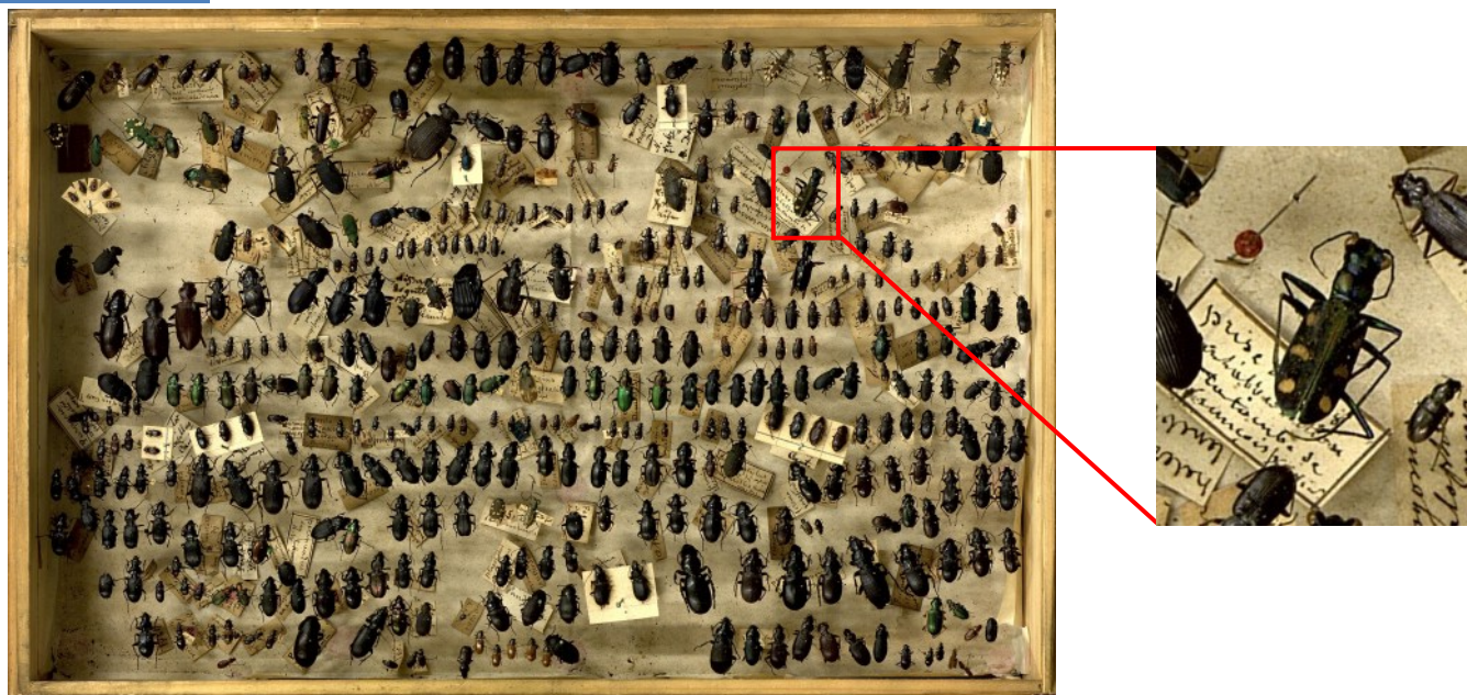
Fig. 1. Boîte de la collection Montrouzier-Perroud avec la cicindèle rapportée par l'abbé Villion (Musée des Confluences, boîte n°464910)