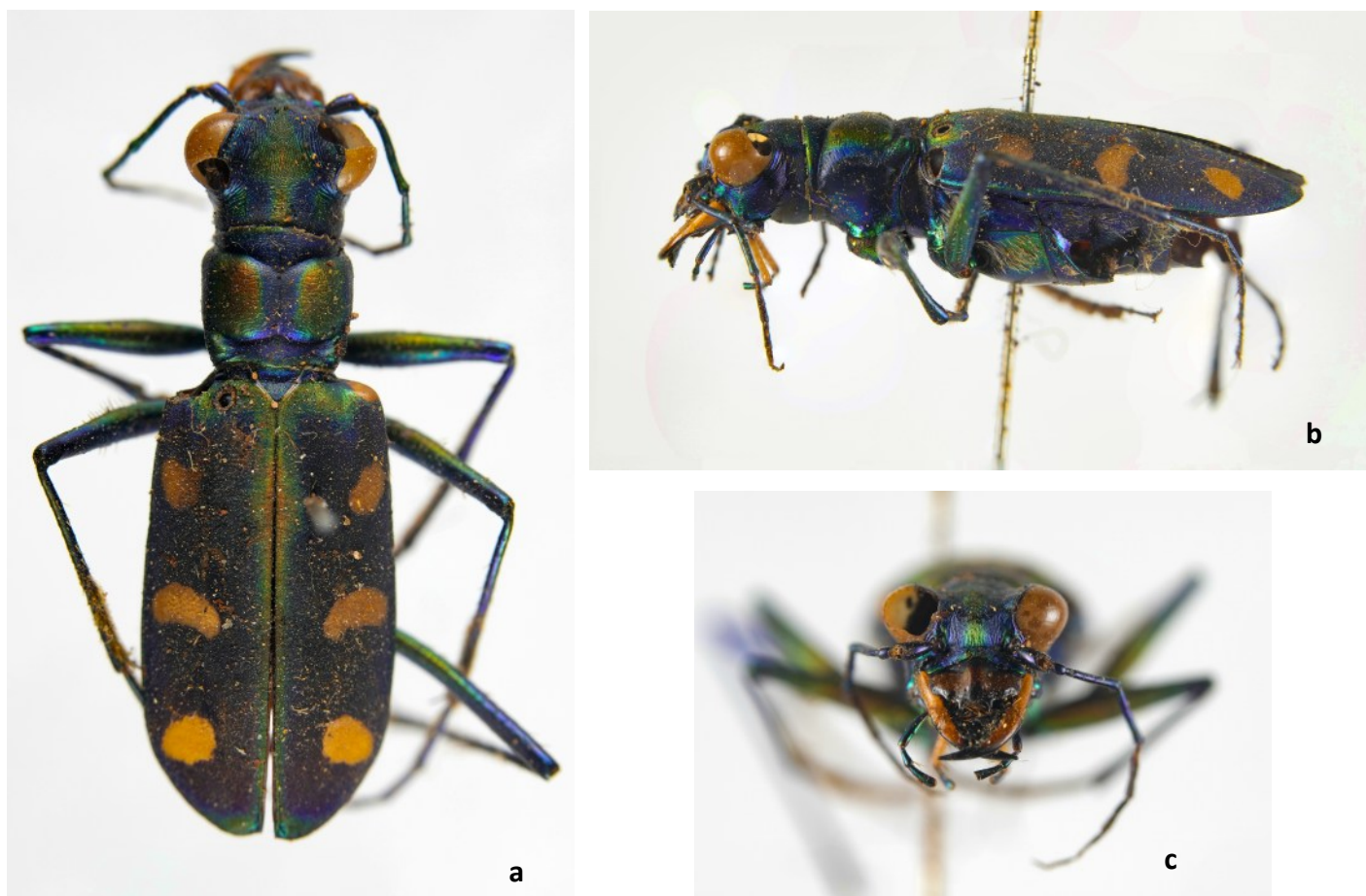
Fig. 4. Cosmodela juxtata Acciavatti & Pearson, 1989. a. vue dorsale, b. vue latérale, c. vue de face. Abbé Villion, 1868, collection Perroud (Musée des Confluences, inv. 47027143)

donnée de l'île de Shangchuan; cette forme est extrêmement proche de notre exemplaire, avec des taches très légèrement réduites par rapport à celles qu'on observe habituellement chez C. juxtata , et qui pourrait faire partie de la même population. F. Boetzl, à qui nous avons demandé un avis sur notre spécimen, a confirmé l'identification de C. juxtata et l'a sexé comme un mâle.