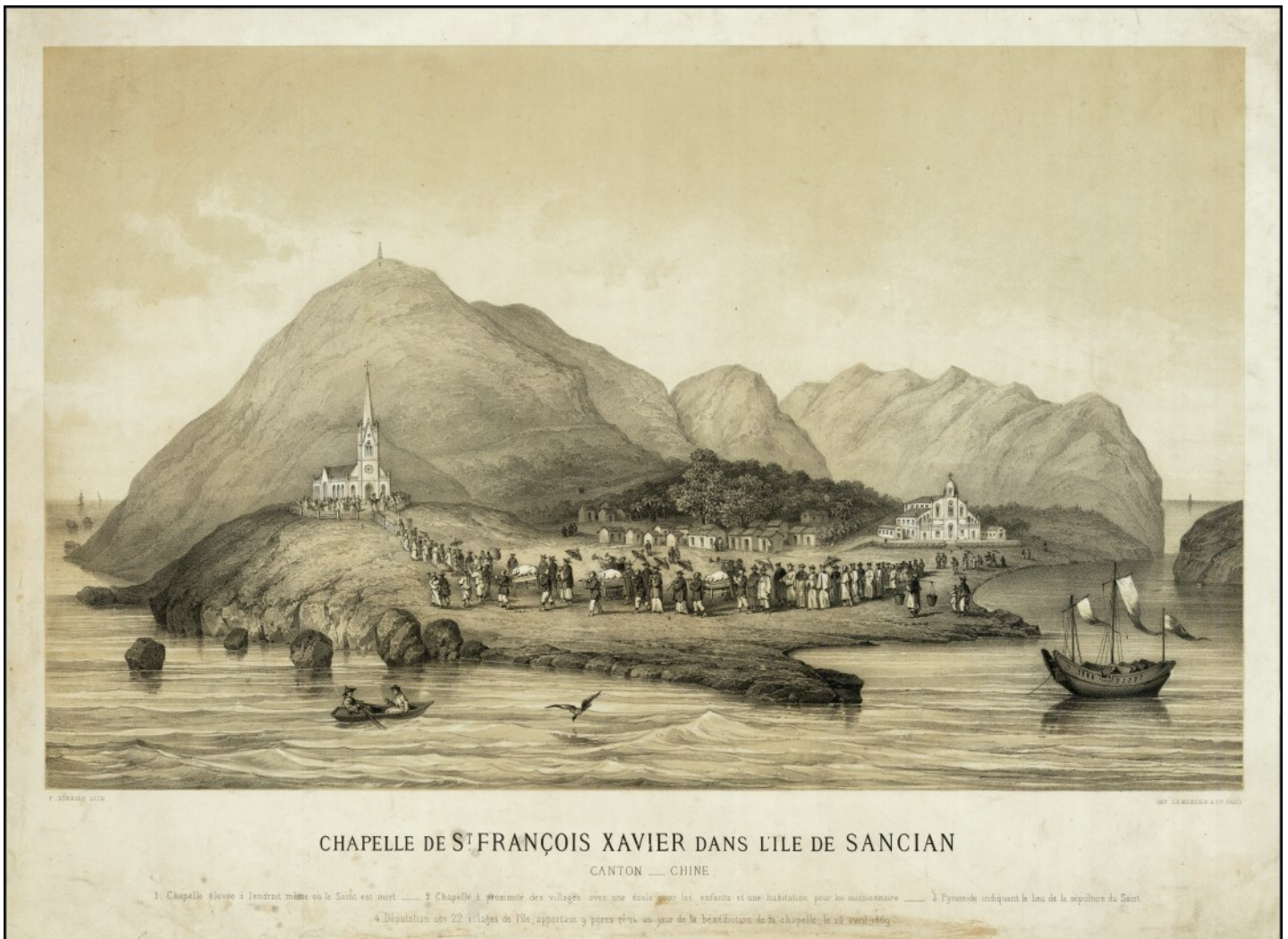
Fig. 5. Chapelle de S t . François Xavier dans l'île de Sancian [Shangchuan], Canton – Chine. Paris, Imp. Lemerrier & Cie, 1870, Chromolithographie, F. Sorrieu, imp. Lemerrier.

montrant la chapelle sur un promontoire et accessible par un chemin côtier. La perspective pouvait laisser penser qu'elle se trouvait plus haut dans l'île où nous la cherchions en vain (nous n'avons pu trouver le « sommet de la Praya »). Transposant ce point sur Google Maps, nous y voyons une photographie aérienne de l'église avec le même positionnement que celui de la vue d'artiste, avec la façade principale donnant sur la mer. L'emplacement de la tombe, d'après Masson (2019 : 207), se trouve sous la chapelle, un peu en avant de l'abside. Les coordonnées de ce lieu sont en WGS84 : 21.74893, 112.77442 (soit 21° 44' 56.15" N, 112° 46' 27.91" E).